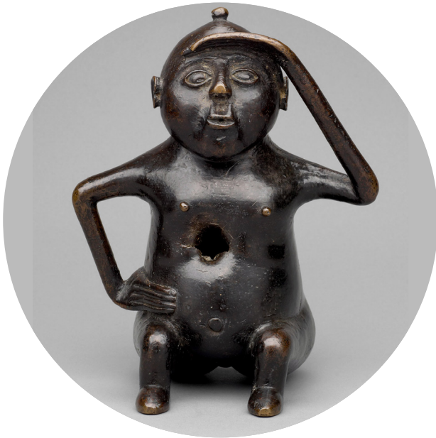
Sog. Püsterich , 1. Hälfte 12. Jahrhundert https://www.khm.at/objektdb/detail/91709/